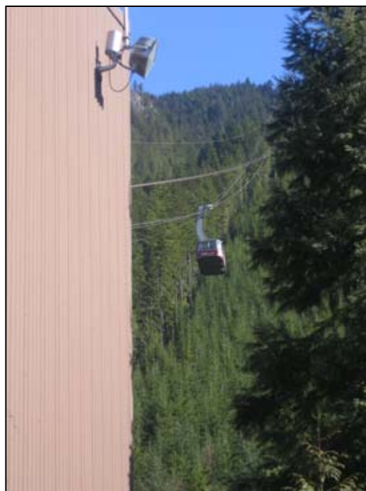
Svævebanen og den vogn vi kørte i

Turen skulle igen være med offentlig transport, faktisk samme vej som da vi skulle til Capilano Suspension Bridge. Vi skulle bare køre lidt længere med samme bus (bus 236, hvis i er interesserede). Og så tage en cable car (en vogn der kører på et kabel, nærmest en svævebane) for at nå toppen. Men en ting der var anderledes, var at vi havde en med i kørestol. Dagens rap: